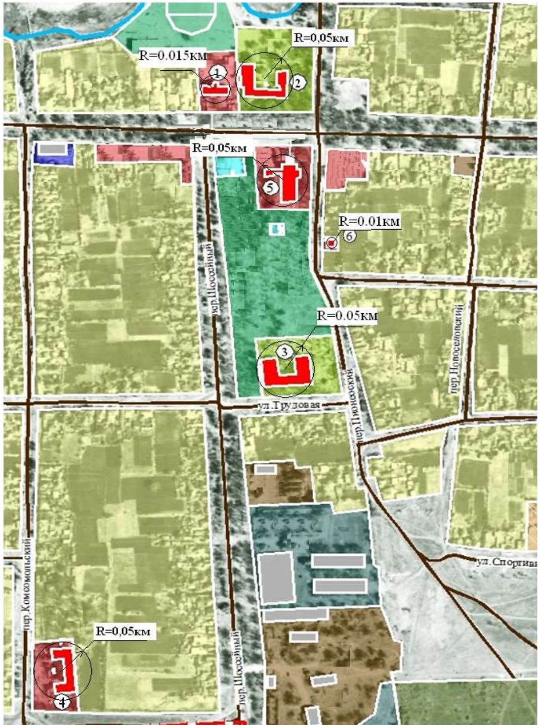
Рисунок 2.1 Радиус эффективного теплоснабжения источников тепловой энергии с.Казгулак.

Схема радиуса эффективного теплоснабжения источников тепловой энергии приведена на рисунке 2.1.