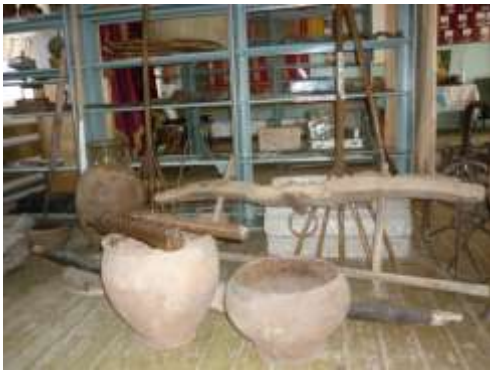
Музей с.Малые Ягуры