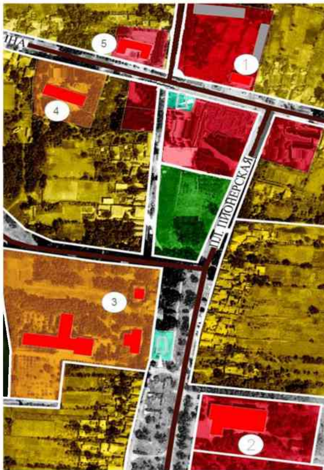
Рисунок 1.1 Источники тепловой энергии: